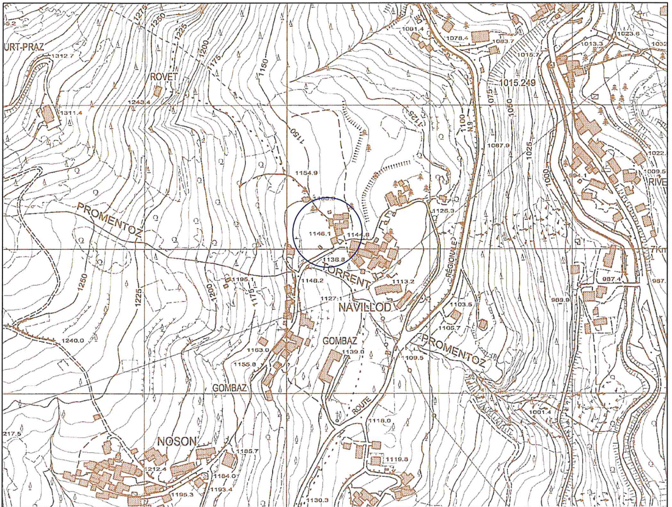
Elenco della CTRN ceduto in data 30/01/2006 n° 987 - Corografia Scala 1:5.000