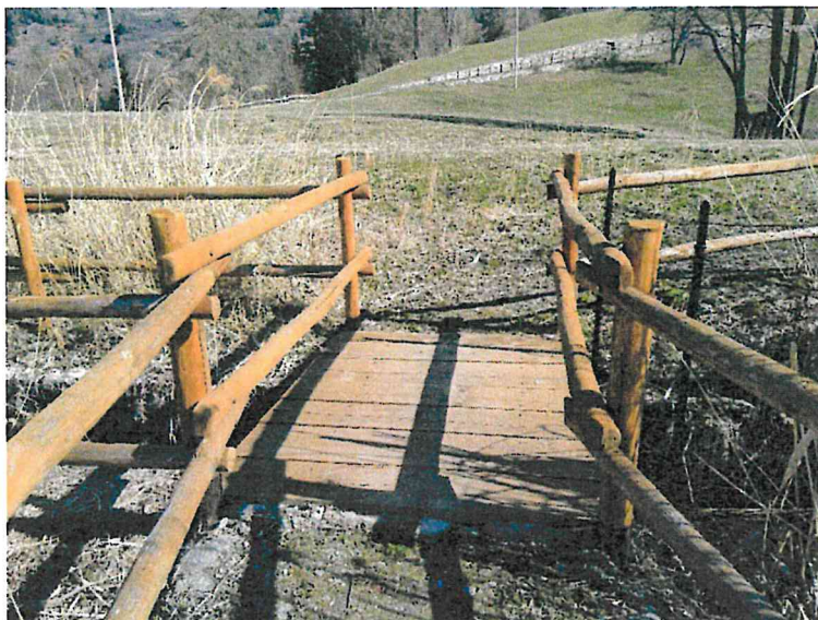
passerella e recinzione esistente